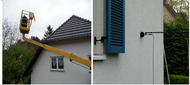
Abbildung 1: Beispiel für eine Beschallungssituation (links) sowie eine Messposition im Nahfeld (rechts)

stück verwendet, ab 630 Hz mit 12 mm-Distanzstück. Die Anregung des Lautsprechers erfolgte über einen variablen Bandpassfilter, um bei den Messungen einen optimalen Signal-Rauschabstand zu erhalten.